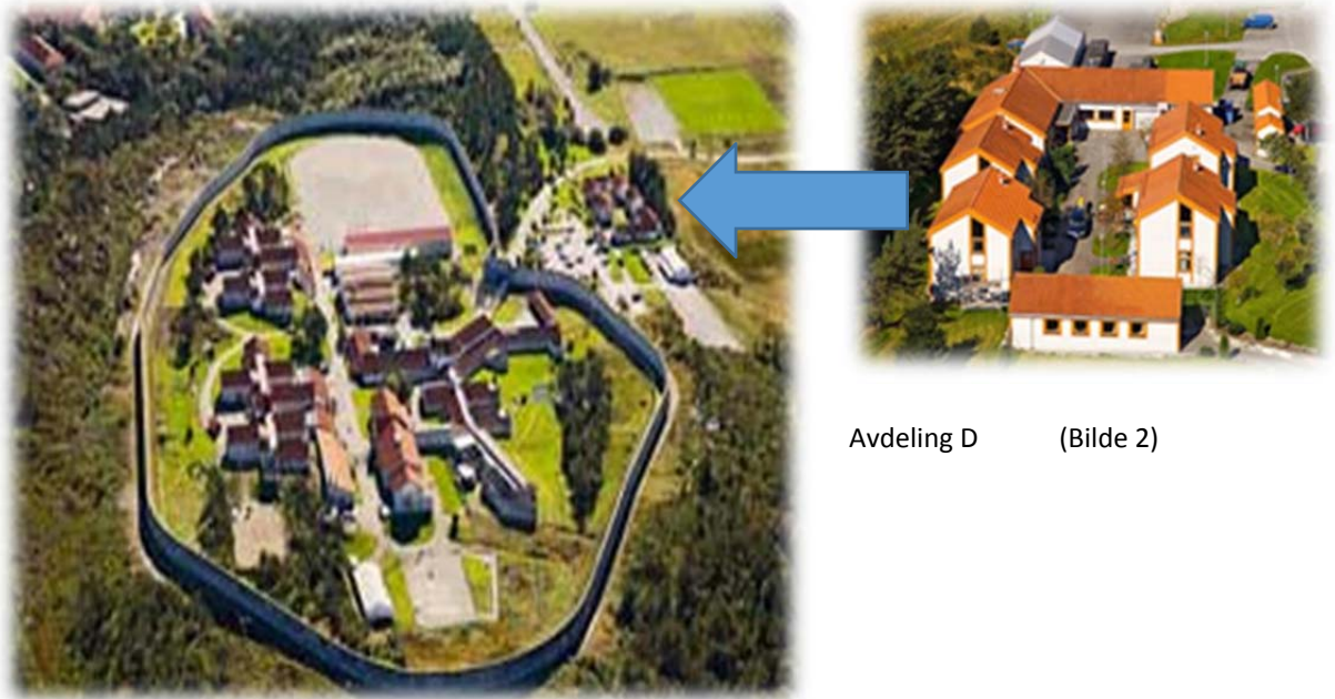
Avdeling D (Bilde 2)

avdelingen rent arkitektonisk. Jeg har derfor valgt ut to bilder fra kriminalomsorgens hjemmeside: