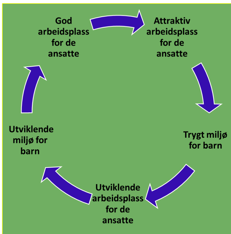
Figur 3. En sirkulær og kontinuerlig modell for arbeidsmiljø og kvalitetsutvikling

Basert på funnene vil vi likevel peke på noen aspekter vi tenker kan være sentrale for hva barnehager og sektoren kan arbeide med framover.