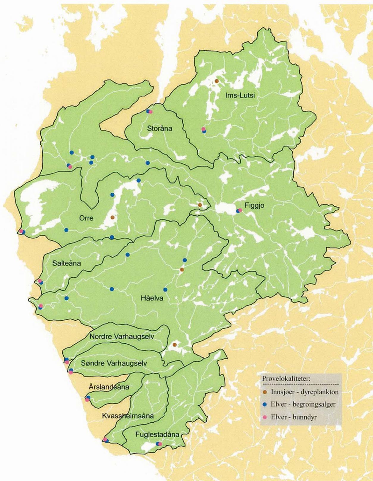
Figur 1. Overvåkingslokaliteter i 2005