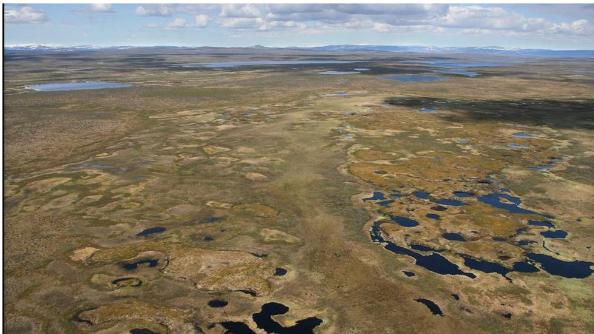
Figur 4. Myrer ved Goahteluoppal i Kautokeino som ikke ble vernet