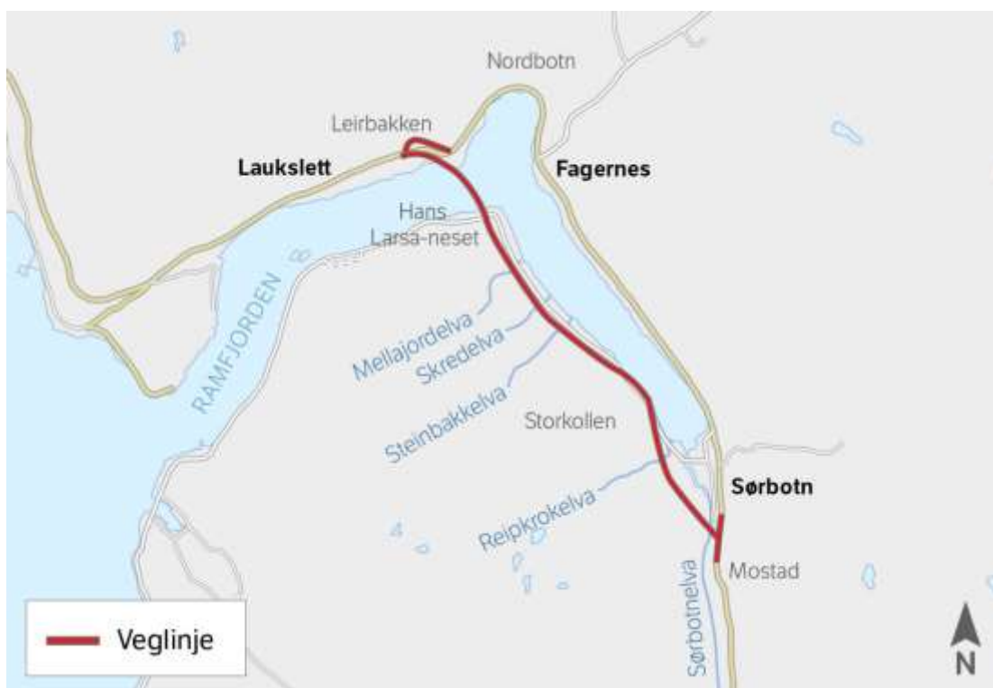
Kart som viser omtrentlig veglinje for vestre trasé. Kilde: Planprogram stadfestet av Tromsø kommune 17.03.2020.

Denne rapporten skal belyse konsekvensene av en E8-utbygging langs vestre trasé, på samisk bosetting og utmarksbruk i Ramfjorden, og søker å dekke det kunnskapsbehovet som beskrives i Sametinget innspill.