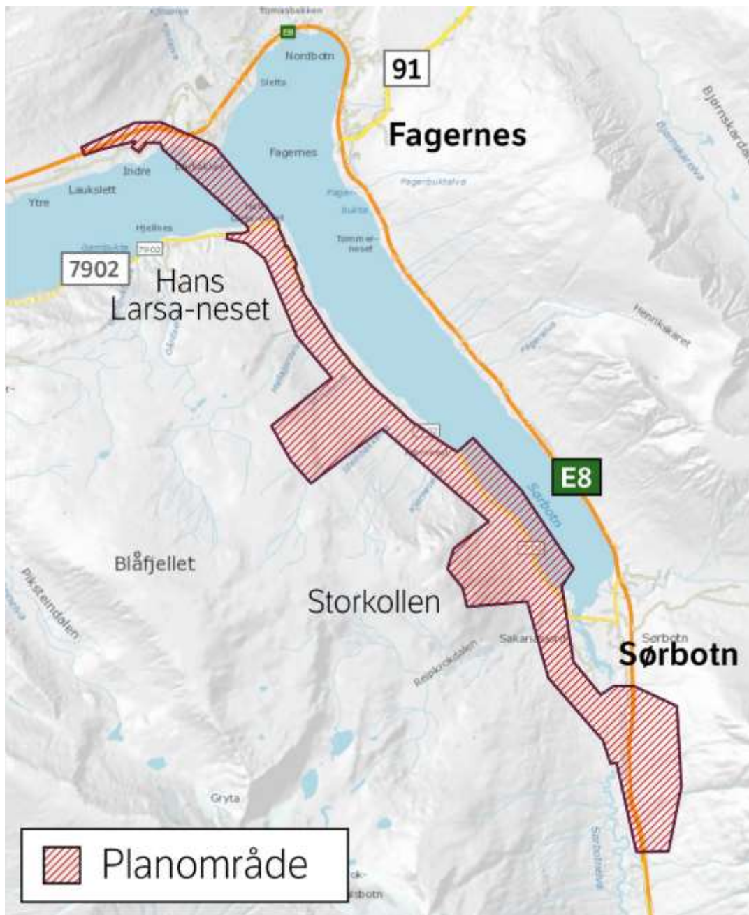
Planområdet for ny reguleringsplan (Statens vegvesen 2020)

I vår gjennomgang av planforslaget baserer vi oss på Vegvesenets forslag til planprogram for strekningen Laukslett-Sørbotn, som skal legges til vestsiden av Gáranasvuotna/Ramfjorden, se figur 24 og 25. Fra Leirbakken til Hans-Larsa-neset vil E8 legges på bru over Gáranasvuotna/Ramfjorden. Strekningen ligger mellom fjell og fjord, og er delvis skredutsatt.