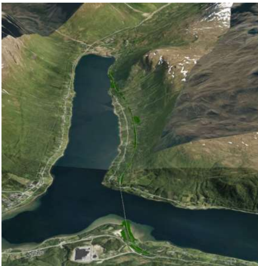
Skissering av E8 Sørbotn-Laukslett vestre trasé: Vegvesenet 2020