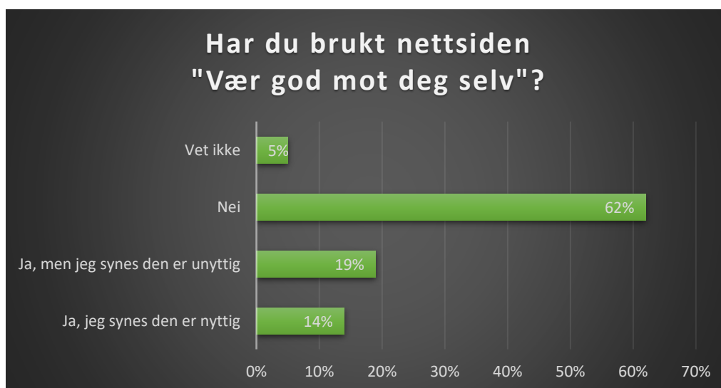
Fig. 2 Har du brukt UiB sin nettside «Vær god mot deg selv»? (N: 2902)

33 % av studentene oppgir at de har brukt UiB sin nettside "Vær god mot deg selv", mens 62 % oppgir at de ikke har brukt den (N: 2902). 14 % av studentene oppgir at de synes nettsiden er nyttig, mens 19 % synes den er unyttig. Dette innebærer at av de 33 % av studentene (n: 936) som oppgir å ha bruk nettsiden opplever 42 % den som nyttig, mens 58 % opplevde den som unyttig.