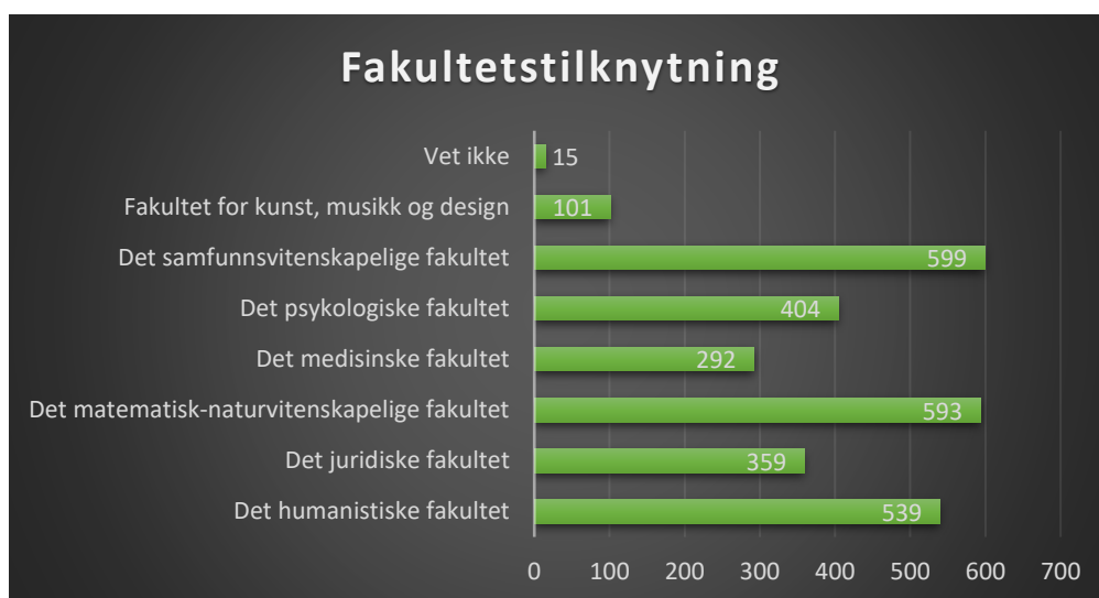
Fig. 1 Antall studenter per fakultet (N: 2902)

Data ble samlet inn gjennom en spørreundersøkelse som ble distribuert til alle studenter ved UiB. 2902 studenter deltok i spørreundersøkelsen om studiesituasjonen høsten 2020 og studenter fra alle universitetets fakulteter er representert. Undersøkelsen ble gjennomført fra 15. desember 2020 til 15. januar 2021. Antall studenter som deltok fra det enkelte fakultet er illustrert i Fig. 1.