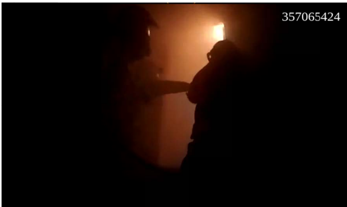
Øvelse 2, husbrenning: Hjelmkamera på røykdykker

Under denne øvelsen var dekning i mobilnettet en stor faktor. Det viste seg at huset lå i mobilskygge, og forbindelsen var derfor svært mangelfull. Dette førte til at video kun sporadisk ble overført, og effekten av kameraene var derfor svært begrenset. Spesifikke observasjoner: