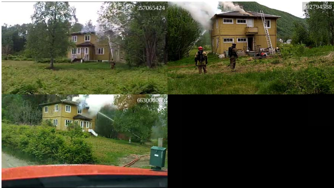
Øvelse 2, husbrenning: To stasjonære og et bilmontert kamera