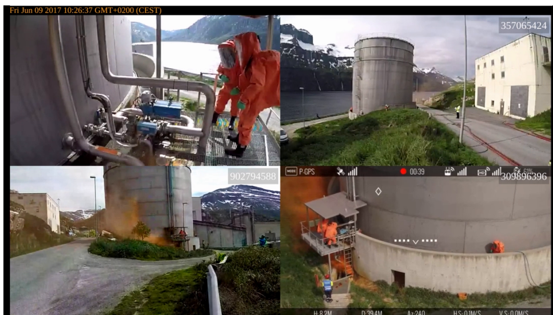
Øvelse 1: Tre stasjonære kameraer samt drone

En syrelekkasje ble iscenesatt ved Yara sin fabrikk i Glomfjord. Her sto en defekt foring i en syretank for en alvorlig lekkasje. Mannskap måtte verifisere defekten, skaffe erstatning og montere denne.