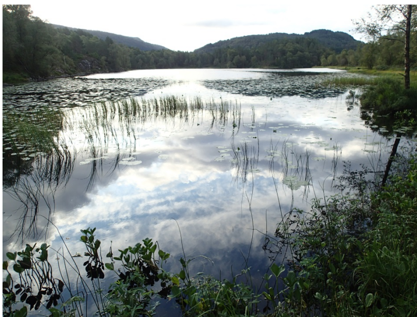
Figur 2. Skodvinstjøret sett frå nordleg bredde og mot sør.