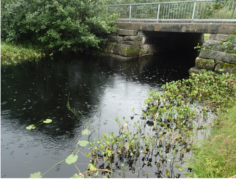
Figur 6. Kanal/ elv mellom Skodvinsvatnet og Gaulevatnet. Deler av kanalen er dekt av ein kulvert. Merka c i Figur 1.