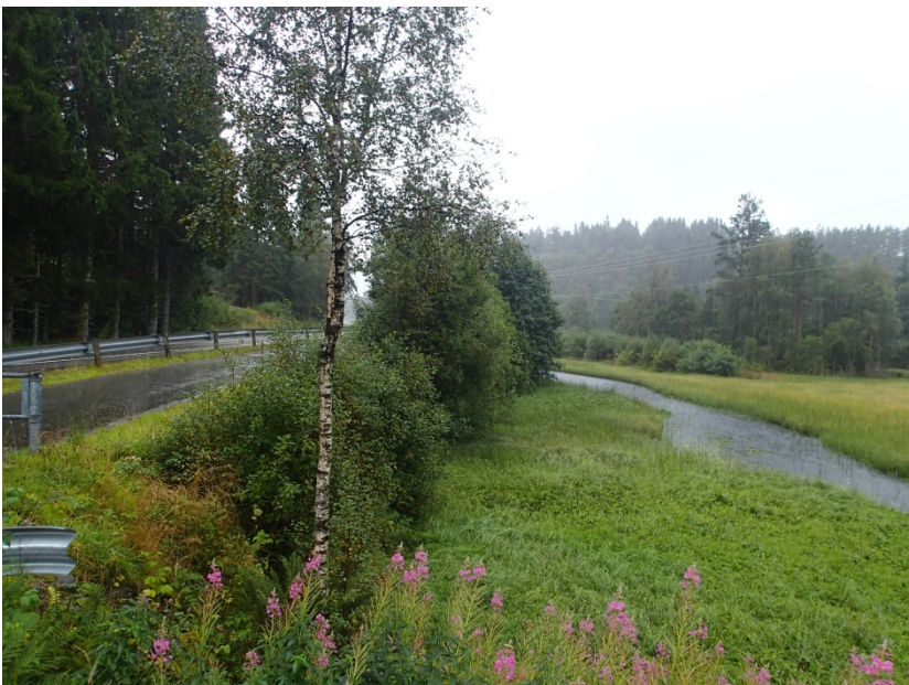
Figur 8. Frå Gaulevatnet renn Gauleelva mot Fjellangsvågen. Elva er omlag 2,1 km lang, der dei første 700-800 m renn langs fv.57, vest for vegen. Denne strekninga er for det meste sakteflytande og med våtmark langs land. Merka d i Figur 1.