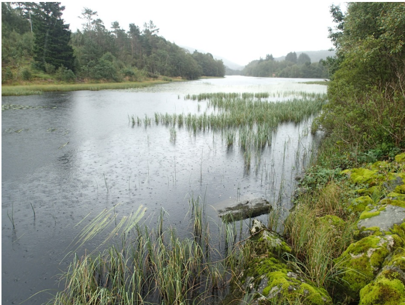
Figur 4. Skodvinsvatnet sett mot søraust. Steinfyllinga frå fv. 57 går delvis ut i vatnet. Merka b i Figur 1.