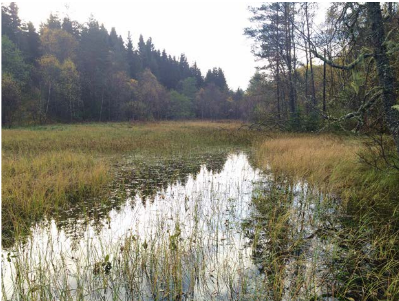
Figur 10. Mellom Våge og Vågseidet ligg ein våtmark, her fotografert mot nord. Fv.57 ligg omlag 15 meter frå våtmarka (mot venstre for biletet). Ein vegfylling ligg mot sør. Merka f i Figur 1.