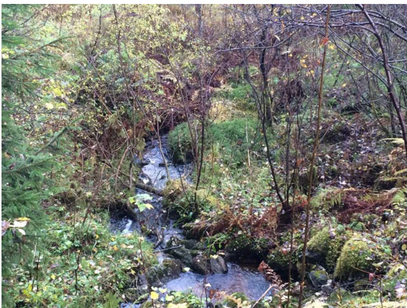
Figur 11. Ein tilløpsbekk renn frå sør mot våtmarka mellom Våge og Vågseidet. Merka g i Figur 1.