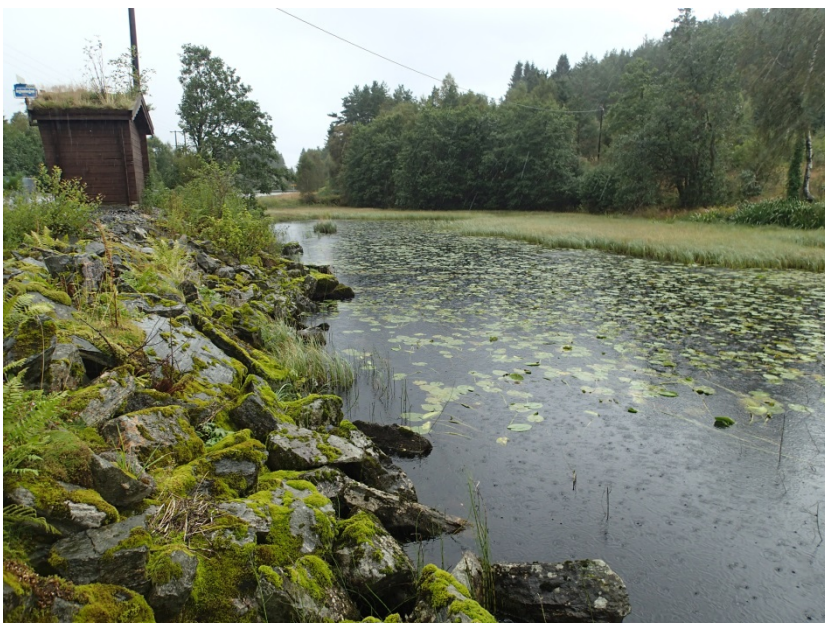
Figur 5. Nordvestre hjørne av Skodvinsvatnet. Vegen går omlag 380 langs vasskanten. Merka b i Figur 1.