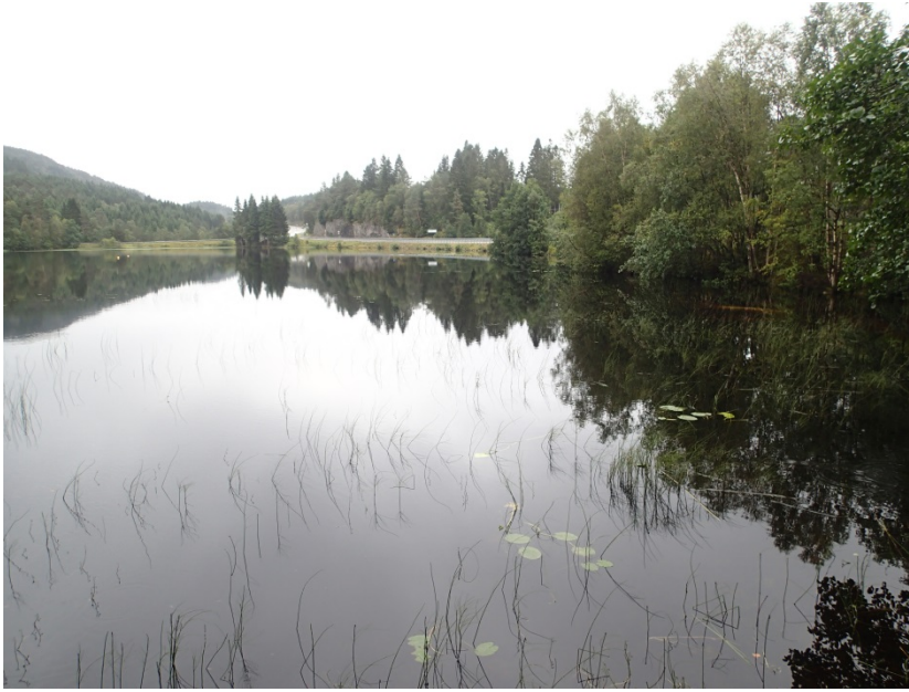
Figur 9. Eidsvatnet ligg rett aust for fv.57. Vatnet er ikkje skjerma for vegen. I forgrunnen veks det kvit nøkkerose og kjerringrokk. Storlom hekkar i vatnet. Merka e i Figur 1.