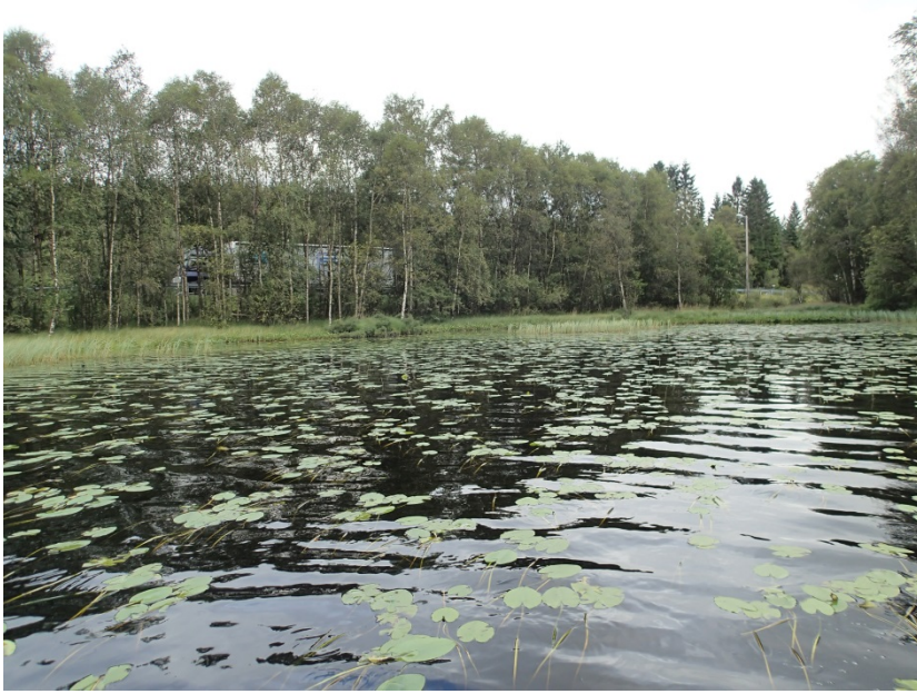
Figur 3. Skodvinstjønet sett mot nordleg bredde i retning fv.57. Legg merke til at vatnet er noko skjerma mot passerande trafikk. Merka a i Figur 1.