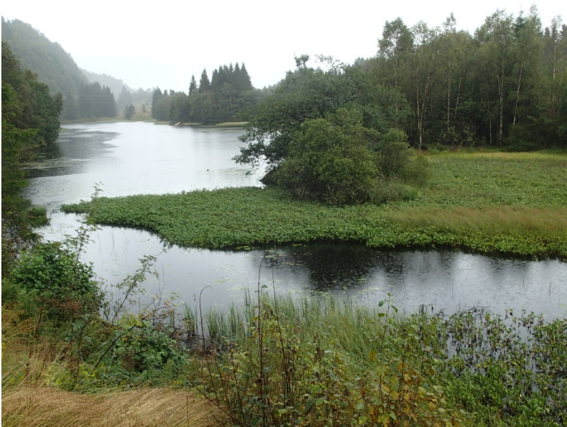
Figur 7. Kanalen frå Skodvinsvatnet renn ut i Gaulevatnet. Langs vasskanten er det våtmark med tett vegetasjon som for det meste består av bukkeblad. Merka c i Figur 1.